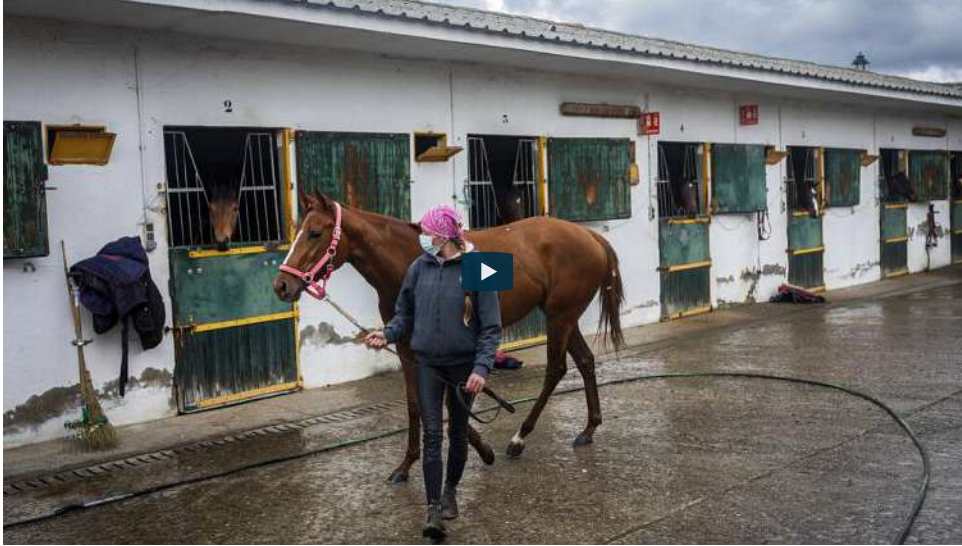
Caballo andando con su dueña en Madrid

Por Juan Carlos De Santos Pascual • última actualización: 10/03/2021 - 17:30