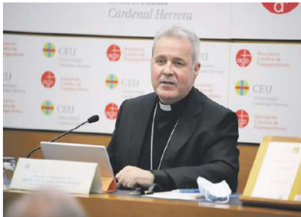
Mons. Iceta durante su intervención en el primer ‘Dies Academicus’.

Las charlas formativas ‘Dies Academicus’ pretenden armonizar la fe, la razón y la vida con asuntos que afectan al ser humano, además de procurar inspirar a todos los profesionales y estudiantes los valores del Evangelio.