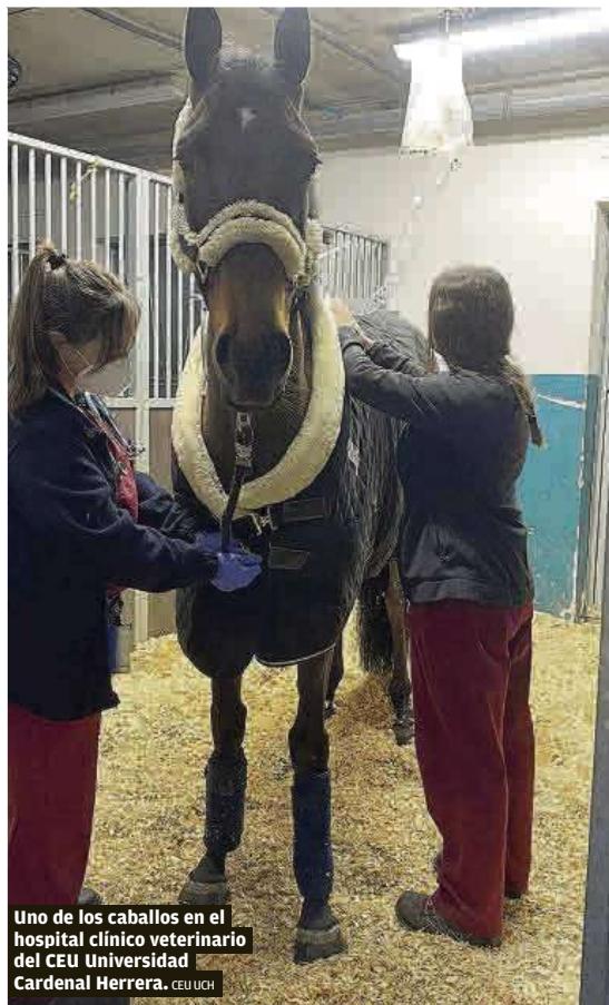
Uno de los caballos en el hospital clínico veterinario del CEU Universidad Cardenal Herrera.

En algunos de estos países la rinoneumonía vírica equina por el herpesvirus tipo 1 es endémica, por lo que están habituados a convivir con la patología. Se trata, además, de una enfermedad no contemplada en la actual Ley de sanidad animal de la Unión Europea. En todo caso, las autoridades sanitarias de los puntos de origen han tenido que enviar detallados protocolos donde describen las actuaciones a realizar para evitar la difusión de la rinoneumonitis.