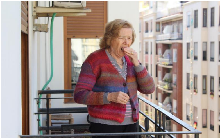
Domingo 29 de marzo. 12:14 pm.