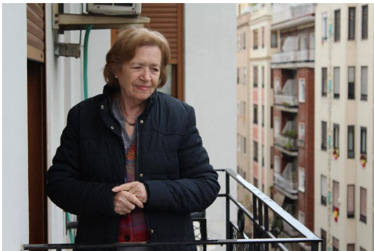
Martes 31 de abril. 12:11 pm