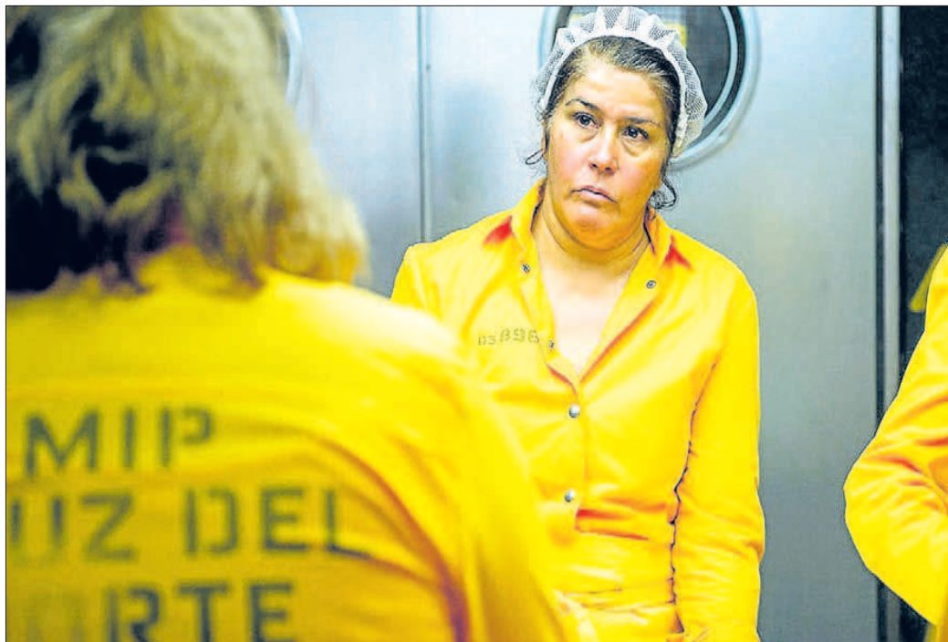
Una imagen del episodio «Fuimos niñas» de la tercera temporada de «Vis a Vis».

La serie se iba a llamar «Mosquita muerta», pero Antena 3, donde se emitieron las dos primeras temporadas, le cambió el nombre final por «Vis a Vis» antes de su estreno, no llegando a utilizar el nombre original en ningún momento.