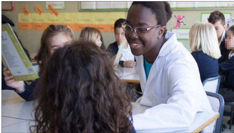
Los alumnos de primero de Magisterio practican metodologías innovadoras en aulas reales. EL MUNDO

«Ha sido una experiencia muy valorada por los estudiantes, pero