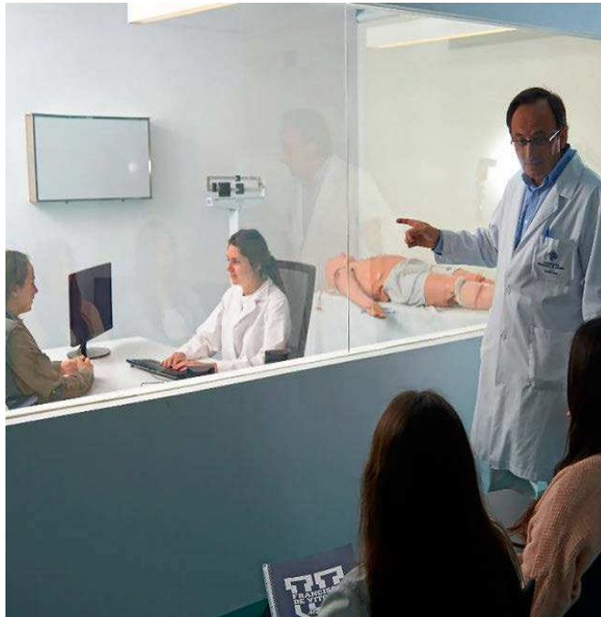
UNIVERSIDAD FRANCISCO DE VITORIA