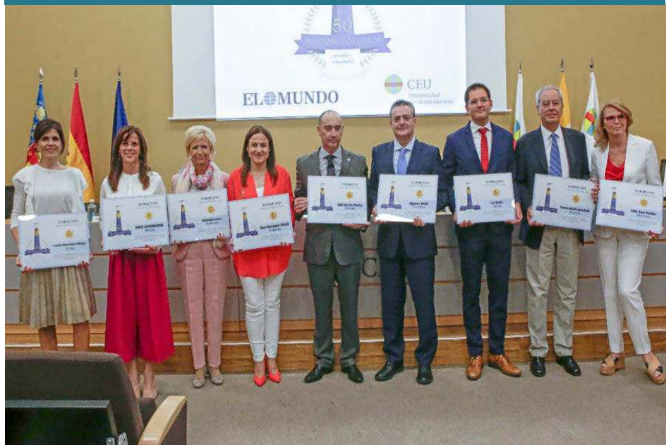
LOS MEJORES COLEGIOS DEL RANKING DE EL MUNDO CV. Los mejores centros educativos según el ranking de EL MUNDO CV recibieron ayer un diploma acreditativo en el CEU San Pablo. Los directores de cada colegio fueron los encargados de recogerlos y posteriormente participaron en un coloquio con docentes y alumnos de Magisterio de la Universidad Ceu Cardenal Herrera.

INTELIGENCIA e intuición, parecen a primera vista o eso nos han hecho creer, que se trata de conceptos contrapuestos, donde dentro de la inteligencia no tenía cabida la intuición, ya que no es un concepto basado en la razón. Es tomado como convencional, que para tomar una decisión cuanto más tiempo y esfuerzo se dediquen a procesar información la decisión tomada será más correcta. Leyendo el libro de Malcolm Gladwell «La Inteligencia Intuitiva» me encontré con un ejemplo que en ocasiones como aficionado me había ocurrido a mí.